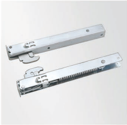
烤箱铰链 Oven hinge