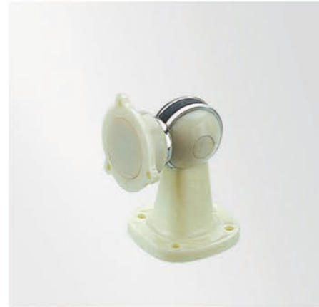
门阻(Spheric Door Magnet)