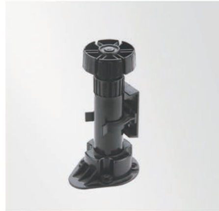
可调脚(Adjustable Plastic Feet) (H=100mm H=120mm H=150mm)