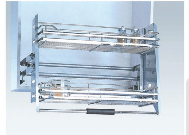
升降拉篮 Lift Basket