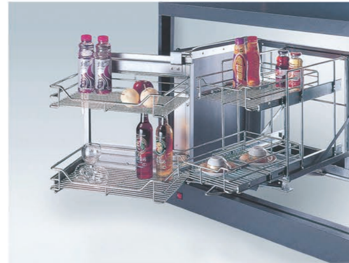
小怪物 Magic Corner